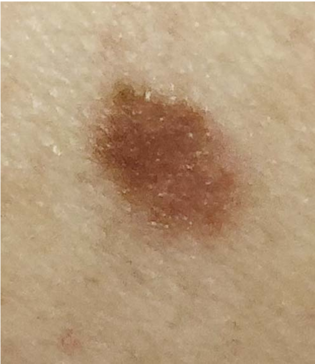
► Abb. 2 Dysplastischer Nävus.