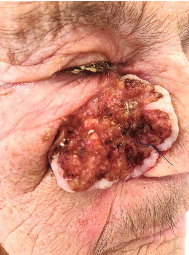
► Abb. 3 Fortgeschrittenes Plattenepithelkarzinom.

Zunahme der epithelialen Hauttumoren um mehr als das Doppelte und das Vorliegen von „weißem Hautkrebs“ bei jedem 10. Patienten des gesetzlichen Screenings. Hier zeigt sich ein enormes, drohendes Risiko der Zunahme von epithelialen Tumoren und ihren Vorstufen in den nächsten Jahren, das sicherlich Auswirkungen auf unser Gesundheitssystem haben wird. Ohne rechtzeitige Intervention, sei es operativ oder mit anderen Methoden wie der photodynamischen Therapie, Imiquimod oder Ingenolmebutat, wird diese Zunahme in naher Zukunft im nördlichen Europa ein erstzunehmendes Problem der Versorgung der Bevölkerung darstellen.